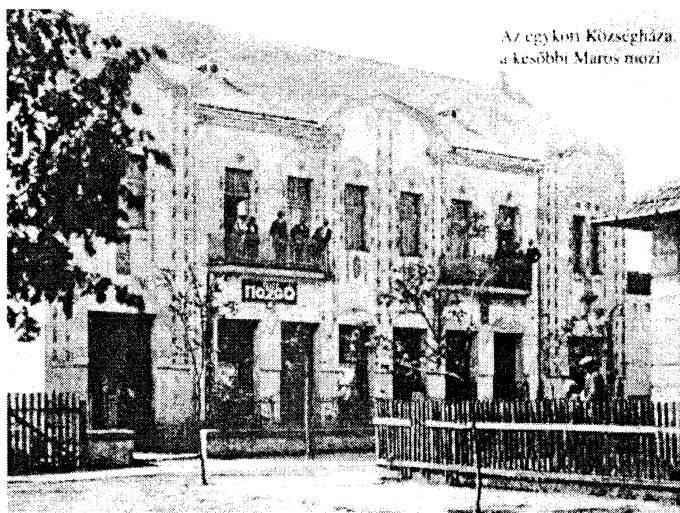
Az egykori Községháza, a későbbi Maros mozi

Eladja az Önkormányzat az egykori Maros mozi épületét! Hiába szerezte meg évekkal ezelőtt a kerület az épület tulajdonjogát, hiába döntött még az előző előtti Képviselőtestület 1997-ben az épület kulturális célú hasznosításáról, hiába készültek el a korszerű belső terek mellett a korabeli külsőt visszaállító felújítási tervek – a jelenlegi döntéshozóknak mindez mit sem számított már.