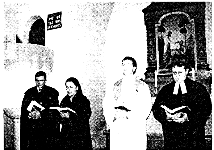
Az utolsó este az evangélikus templomban

Tizenhárom év kihagyás után tartották meg újra a ligeti egyházközösségek ökumenikus (a Krisztus-hívők egységére törekvő) imahétét január 16-17-18-án. A három estén a közös imádságra és elcsendesedésre vágyókat a három felekezet saját templomában látta vendégül.