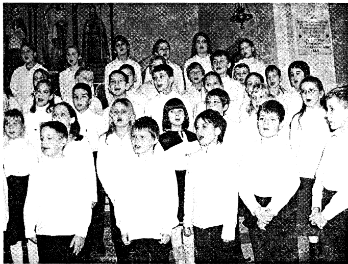
A karácsonyi koncert megható színfoltja minden évben a kicsinyek kórusának műsora

Csodálatos élményben volt részük azoknak, akik advent idején eljöttek a Hősök terei iskola karácsonyi koncertjére a rákosligeti Magyarok Nagyasszonya római katolikus templomba.